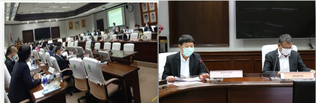
ภาพการประชุมคณะกรรมการสาธารณสุข