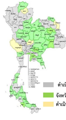
พ.ร.บ. ตั้งครุฑ