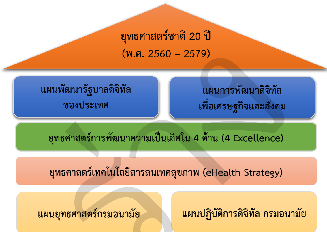
ภาพที่ 2.1 กรอบแนวทางการศึกษาความเชื่อมโยงนโยบาย แผน และยุทธศาสตร์