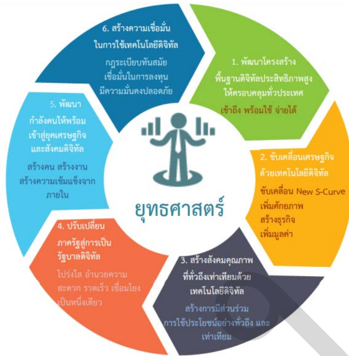
ภาพที่ 2.3 ยุทธศาสตร์การพัฒนาดิจิทัลเพื่อเศรษฐกิจและสังคม

ยุทธศาสตร์ที่ 1 พัฒนาโครงสร้างพื้นฐานดิจิทัลประสิทธิภาพสูงให้ครอบคลุมทั่วประเทศ มุ่งพัฒนาโครงสร้างพื้นฐานดิจิทัลประสิทธิภาพสูง ที่ประชาชนทุกคนสามารถเข้าถึงและใช้ประโยชน์ได้แบบทุกที่ ทุกเวลา โดยกำหนดให้เทคโนโลยีที่ใช้มีความเร็วพอเพียงกับความต้องการ และให้มีราคาค่าบริการที่ไม่เป็นอุปสรรคในการเข้าถึงบริการของประชาชนอีกต่อไป นอกจากนี้ ในระยะยาว โครงสร้างพื้นฐานอินเทอร์เน็ตความเร็วสูงจะกลายเป็นสาธารณูปโภคขั้นพื้นฐาน เช่นเดียวกับ ถนน ไฟฟ้า น้ำประปา ที่สามารถรองรับการเชื่อมต่อของทุกคนและทุกสรรพสิ่ง