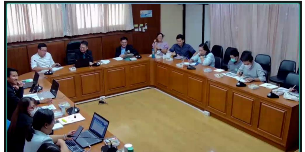
ภาพบรรยากาศการประชุมฯ มีเลขานุการ 7 กลุ่มส่งเสริมสุขภาพ กลุ่มสร้างความรอบรู้ฯ กลุ่มอนามัยสิ่งแวดล้อม และกลุ่มพัฒนายุทธศาสตร์กำลังคน เข้าร่วม ณ ห้องประชุมสำนักโภชนาการ 24 พฤษภาคม 2567 เวลา 9.30 – 12.00 น.